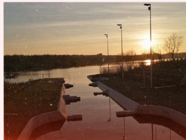
Vue depuis les chambres