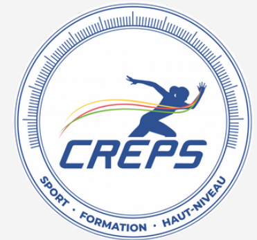
Quentin FREROT (Kinésithérapeute)